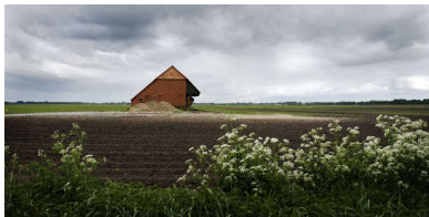
Nieuw Buinen. reyer boxem