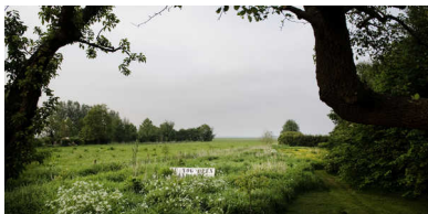
Protestbord bij Gasselternijveen. reyer boxem